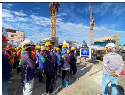
รูปที่ ผ7.64 Tool box talks ก่อนการเริ่มงาน