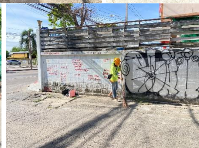
รูปที่ ผ7.65 กิจกรรมความรับผิดชอบต่อสังคม (Corporate social responsibility : CSR) ของโครงการ