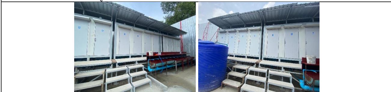
รูปที่ ผ7.69 ห้องน้ำ บริเวณบ้านพักคนงาน