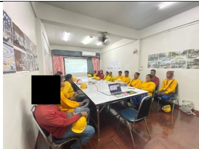
รูปที่ ผ7.66 การอบรมให้ความรู้ในการทำงานแก่เจ้าหน้าที่ และคนงาน