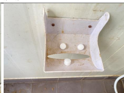
รูปที่ ผ7.67 การกำจัดสัตว์ที่เป็นพาหะนำโรค