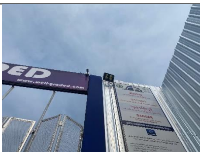
รูปที่ ผ7.63 กล้องวงจรปิด (CCTV)

ภาพถ่ายผลการปฏิบัติตามมาตรการป้องกันและแก้ไขผลกระทบสิ่งแวดล้อม และมาตรการติดตามตรวจสอบคุณภาพสิ่งแวดล้อม โครงการ แอทโมซ พาลาซิโอ ลาดพร้าว-วังหิน (ATMOZ PALACIO LADPRAO-WANGHIN) ประจำเดือนมกราคม-มิถุนายน 2567